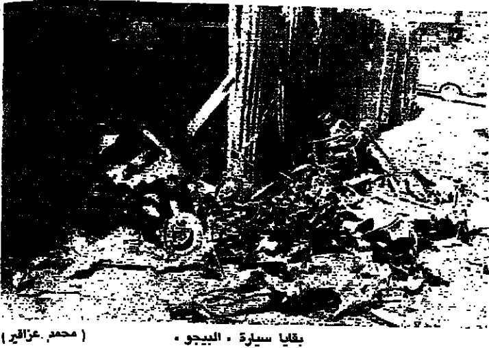
بقايا سيارة البيجو - محمد عزراي